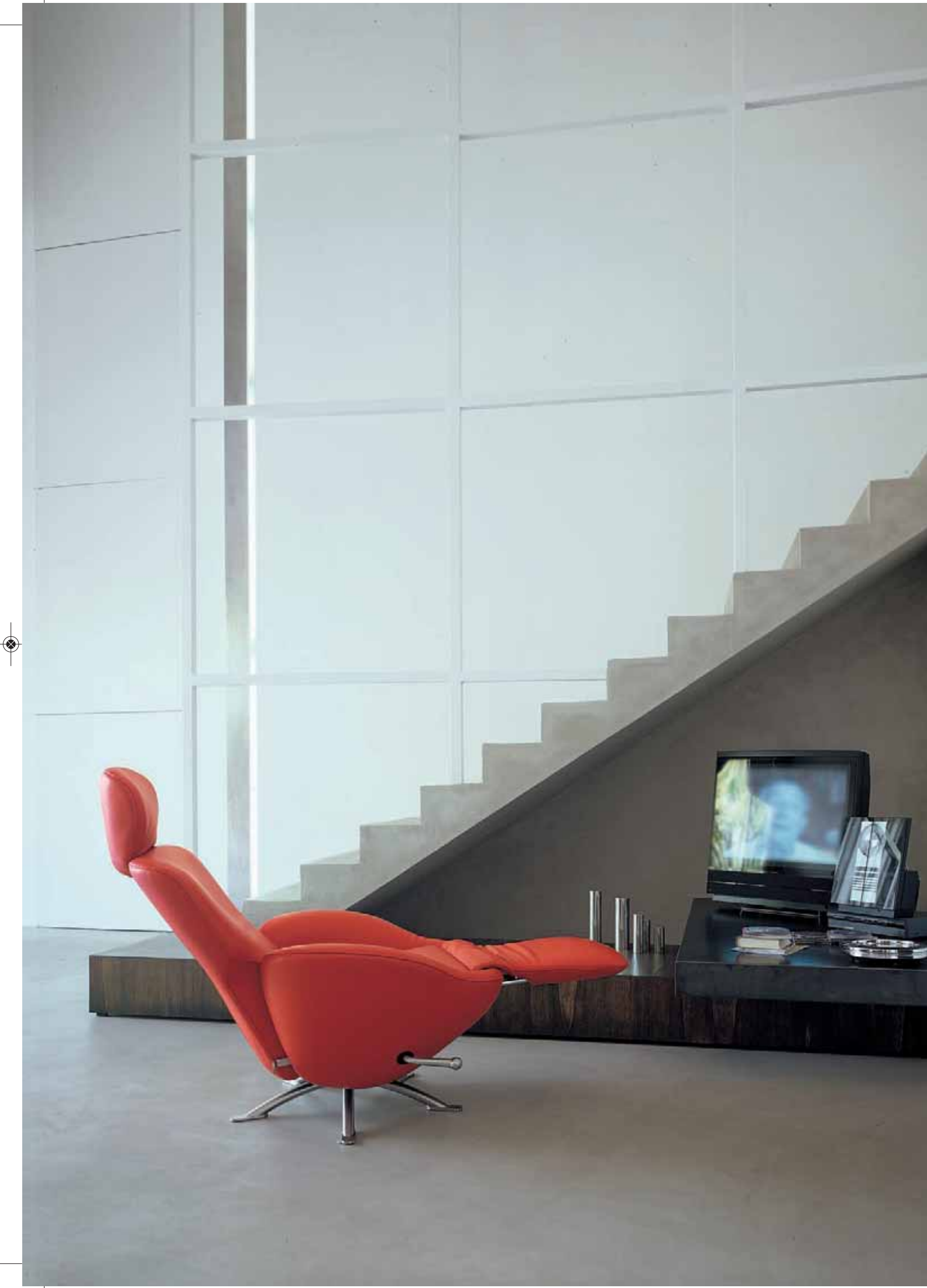
Toshiyuki Kita DODO