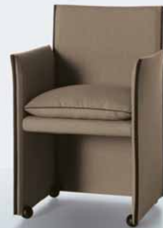
Mario Bellini BREAK

Petit fauteuil avec accoudoirs. Structure à panneaux, châssis portant en acier, rembourrage en mousse de polyuréthane, fermetures-éclair cousues dans le revêtement. Coussin assise rembourré en plume. Revêtement en tissu (avec profils en cuir disponibles dans de différentes couleurs) ou cuir. Pieds en matière plastique noire. La version avec roulettes est aussi disponible.