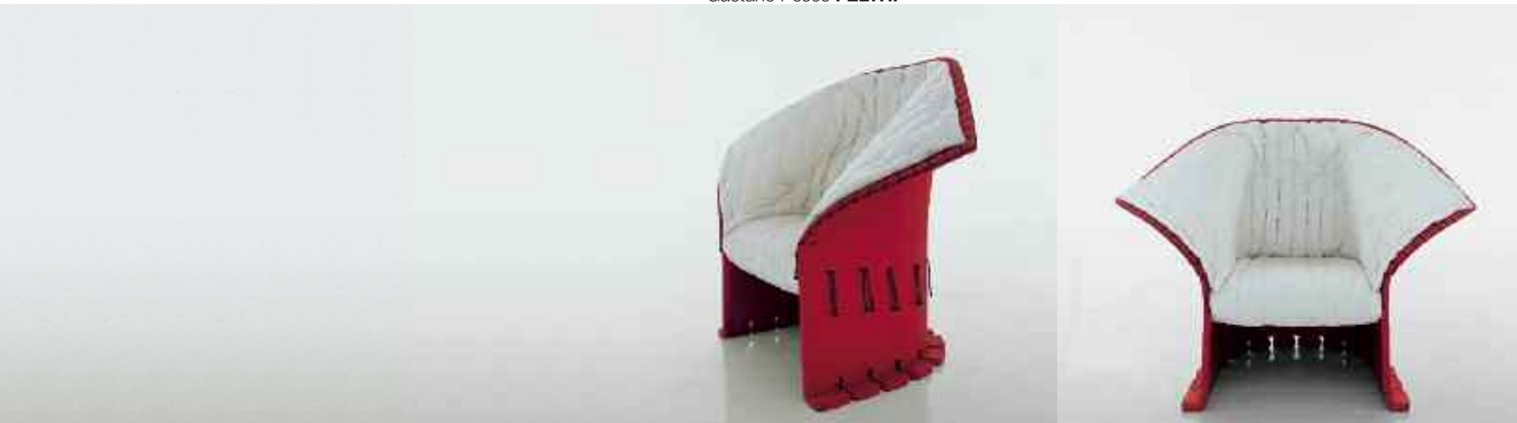
Gaetano Pesce FELTRI

Fauteuil haut dossier et fauteuil bas dossier totalement réalisés avec un feutre de laine épais. Dans la partie inférieure, le feutre est imprégné de résine thermodurcissante qui assure rigidité et résistance. Le siège est fixé à la structure portante au moyen de ficelles de chanvre qui bordent également la partie supérieure souple de l'assise. Le fauteuil est complété par une housse en tissu matelassé, couplé avec ouate de polyester, disponible en plusieurs couleurs.